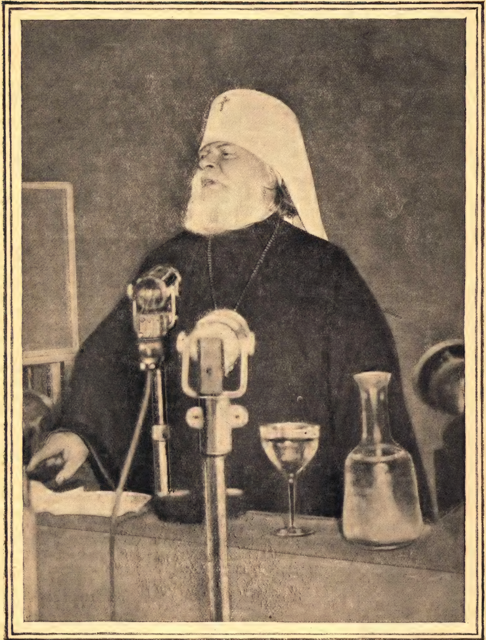
Митрополит Николай произносит речь на Всемирном Конгрессе сторонников мира в Париже